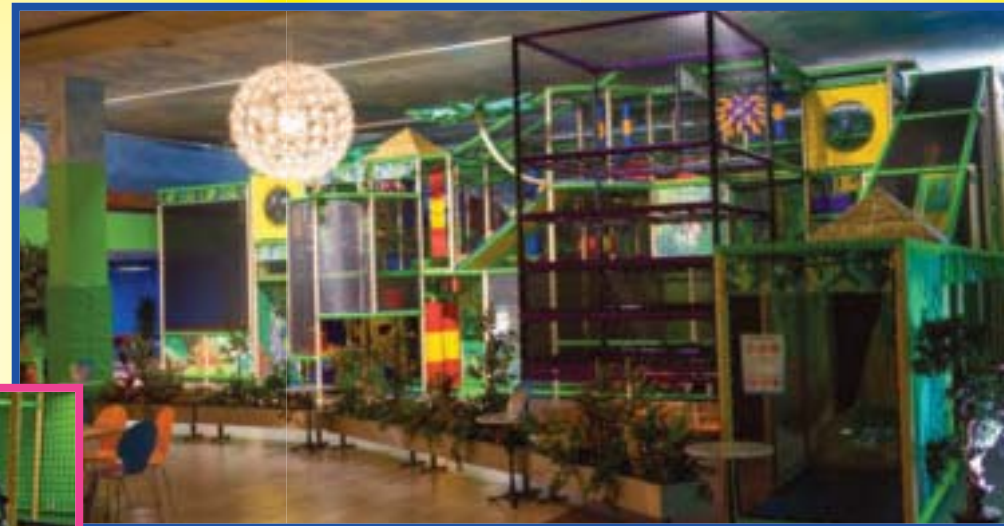
Großer Kletterturm bis 12 Jahre

Der große Kletterturm mit vielen Hindernissen, Funshooter, Spidertower, Elektrokart-Bahn, Doppelrutsche, Spiralrutsche und Kindertrampolinanlage.